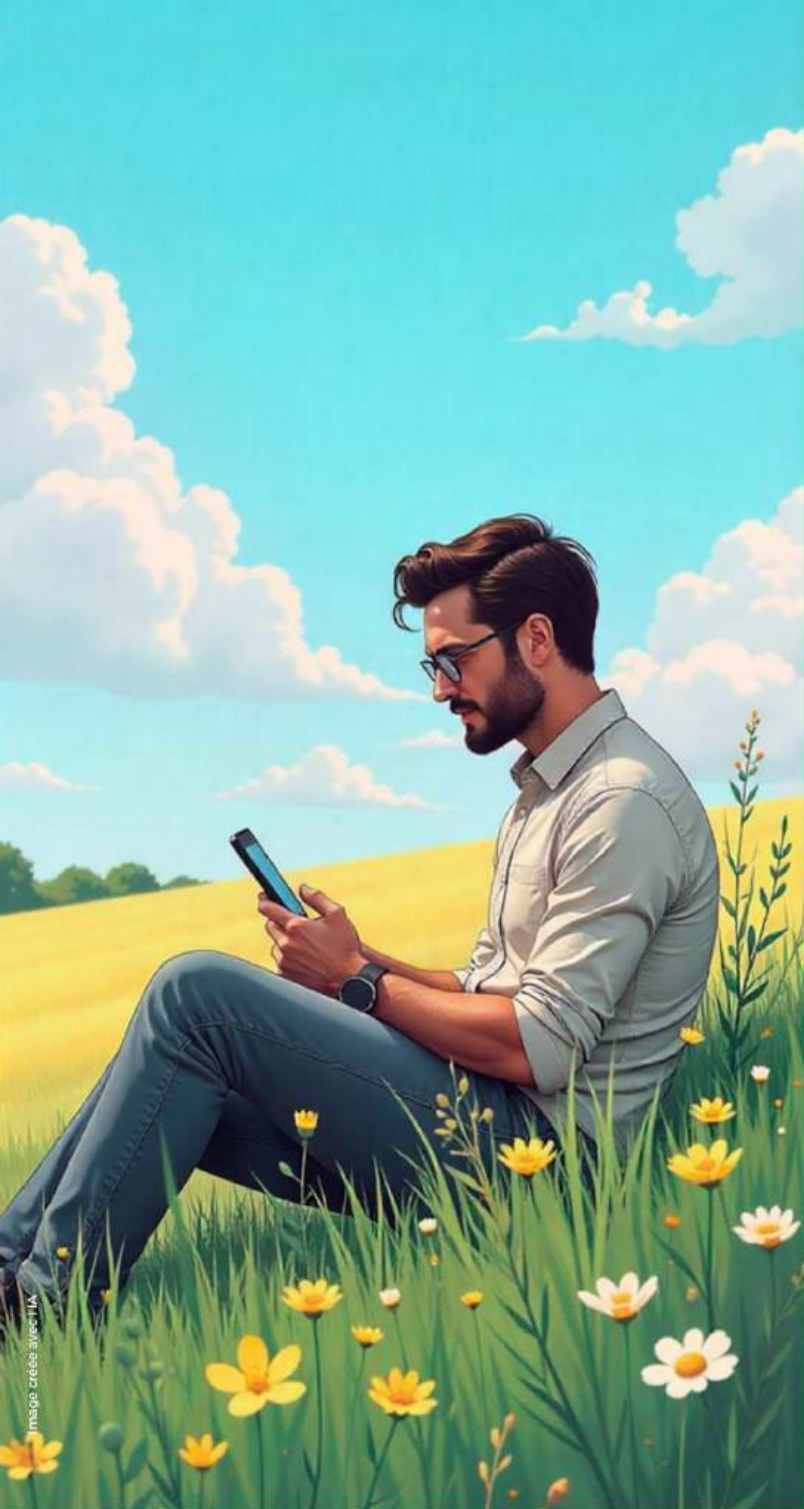
Image créée avec IA