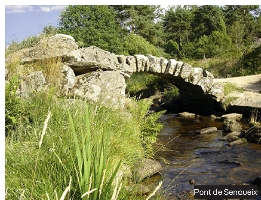
Pont de Senoueix