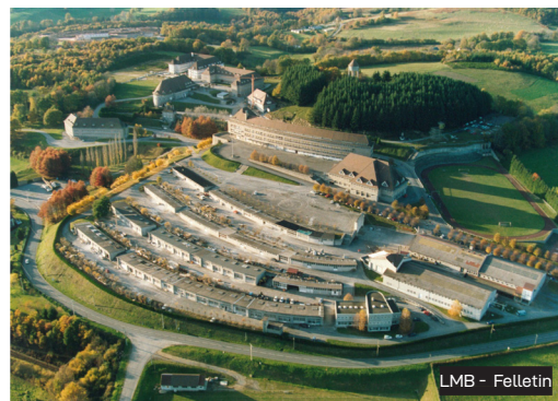
LMB - Felletin