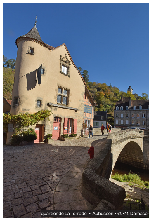
quartier de La Terrade - Aubusson