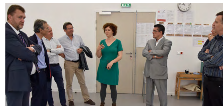
À la Cité de la Tapisserie