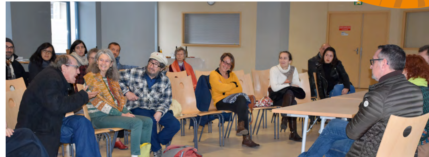
Un moment d'échange fructueux !