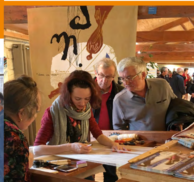
Un tissage apprécié par le public