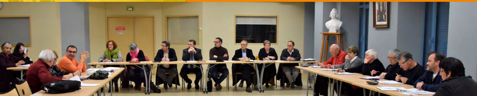
La réunion du conseil municipal du 17 décembre 2018 s'est tenue dans la salle des conférences au rez-de-chaussée du bâtiment.

Depuis le 26 novembre 2018, la mairie d'Aubusson s'est installée au 3 ème étage de la Passerelle.