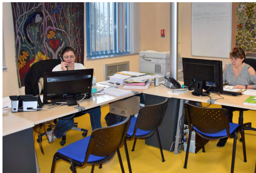
Le nouvel accueil de la Mairie

Les agents communaux y travaillent dans de très bonnes conditions. Le service qu'ils rendent aux usagers n'en est que meilleur ! Désormais, la Mairie est également ouverte le vendredi après-midi.