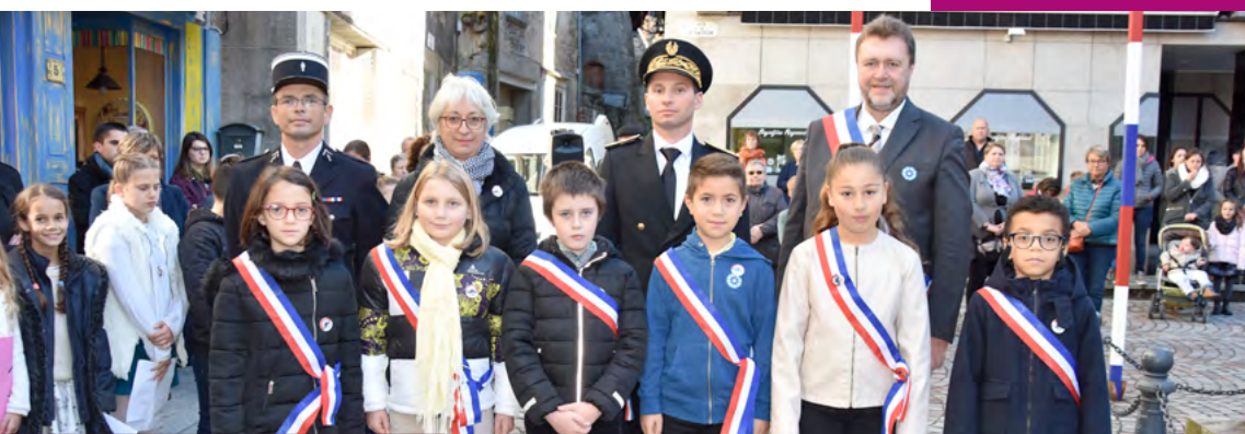
Avec les autorités locales

Le 11 novembre, centenaire de l'armistice de 1918, les jeunes Conseillers municipaux étaient présents pour déposer avec le maire une gerbe au pied du monument aux morts.