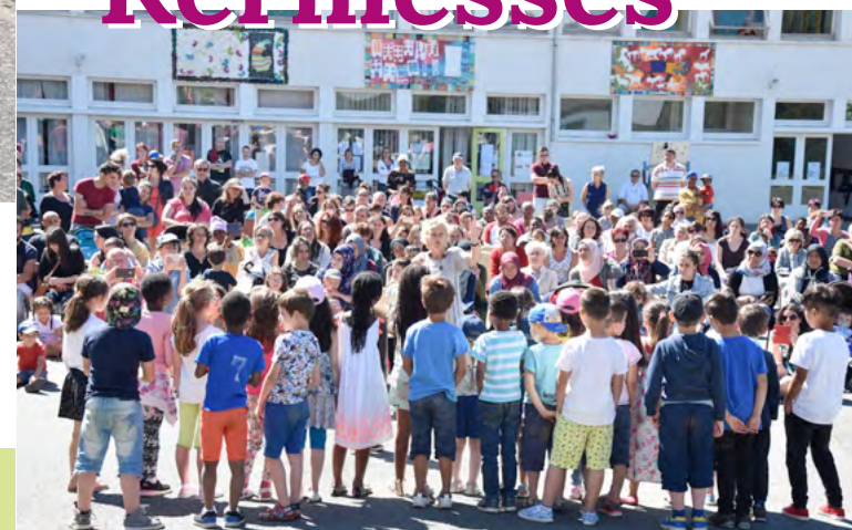
À la Clé des Champs