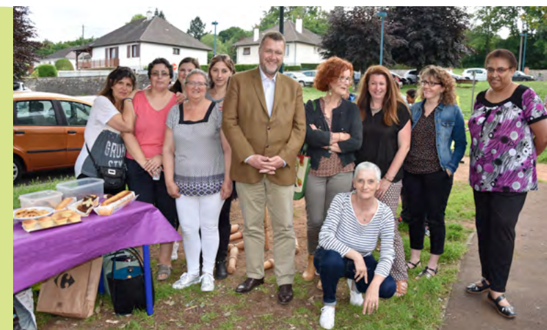
Avec les bénévoles de Parenthèse

Les écoliers, leurs parents et les enseignants se sont retrouvés toute une après-midi ludique à l'école La clé des Champs. Jeux, discussions...et chant! Chaque classe a interprété une chanson devant un auditoire conquis.