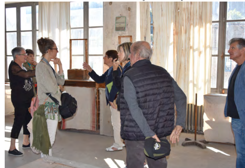
Des visiteurs très attentifs aux explications

Les documents seront scannés, restitués et pourront être exposés pour les ouvertures au public prochaines de la Manufacture.