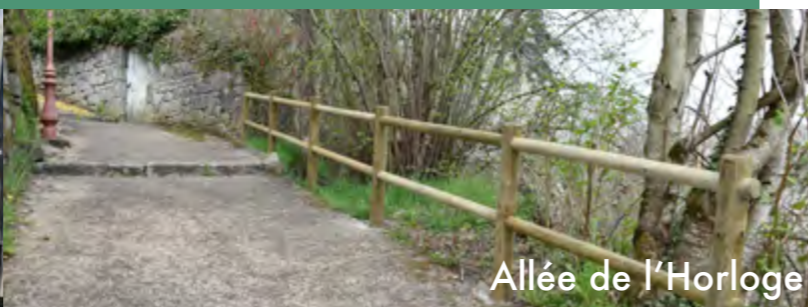
Allée de l'Horloge