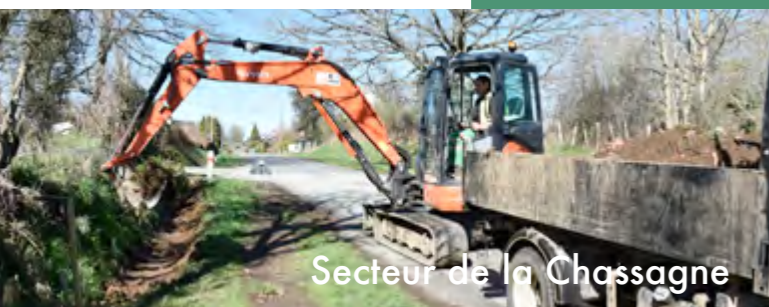
Secteur de la Chassagne